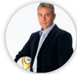
Juvenal Olmos Comentarista FOX y CDF Chile DT Selección De Chile U. Católica Campeón